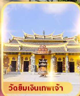
วัดยิมเจินเทพเจ้า