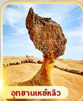
อุทยานเหย์หลิว