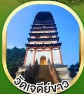
วัดเจดีย์ขาว