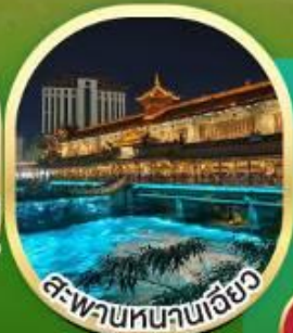
สะพานหนานหนานเอียว