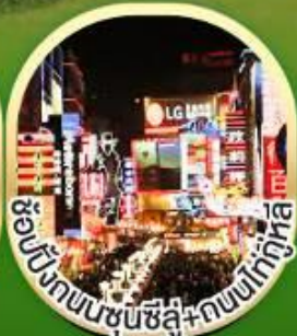
ช้อปปิ้งถนนชุนซีลู่+ถนนไท่กุ่หลี่