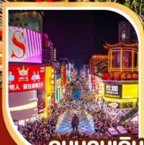
ถนนคนเดิน หวงซิงลู่