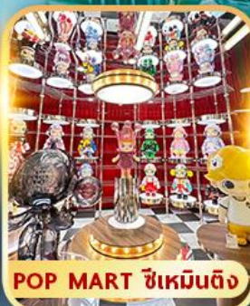
POP MART ชีเหมินตง