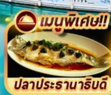
เมนูพิเศษ!! ปลาประจานาธิบติ