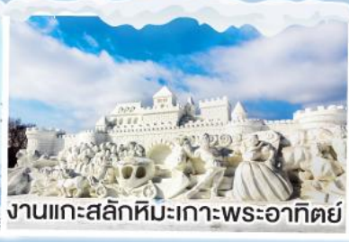
งานแกะสลักหิมะเกาะพระอาทิตย์