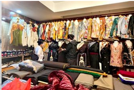
ศูนย์จำหน่ายอุปกรณ์กันหนาว