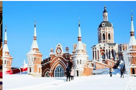
สวน LITTLE RUSSIA