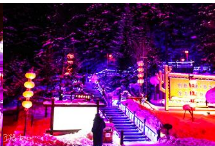
ระเปียงชมวิว ปั้งจูชาน