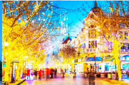
ถนนจางยวู่